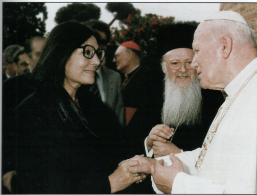
Nana Mouskouri with His Holiness Jean-Paul II and Patriarch Bartholomeus.

Si c'était à refaire, je choisirai le même destin.